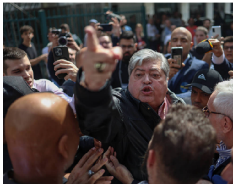
José Luiz Datena critica tucanos que defendem o prefeito Ricardo Nunes

Em diversos momentos, o apresentador insinuou, ressaltando que ainda cabe investigação, haver ligação entre os tucanos opositores e Nunes e também ao crime organizado. “Isso é misturado a bandidos que estão querendo manter o crime organizado no poder. [...] Nem sei se tem gente do PCC misturada aqui, fazendo baderna.”