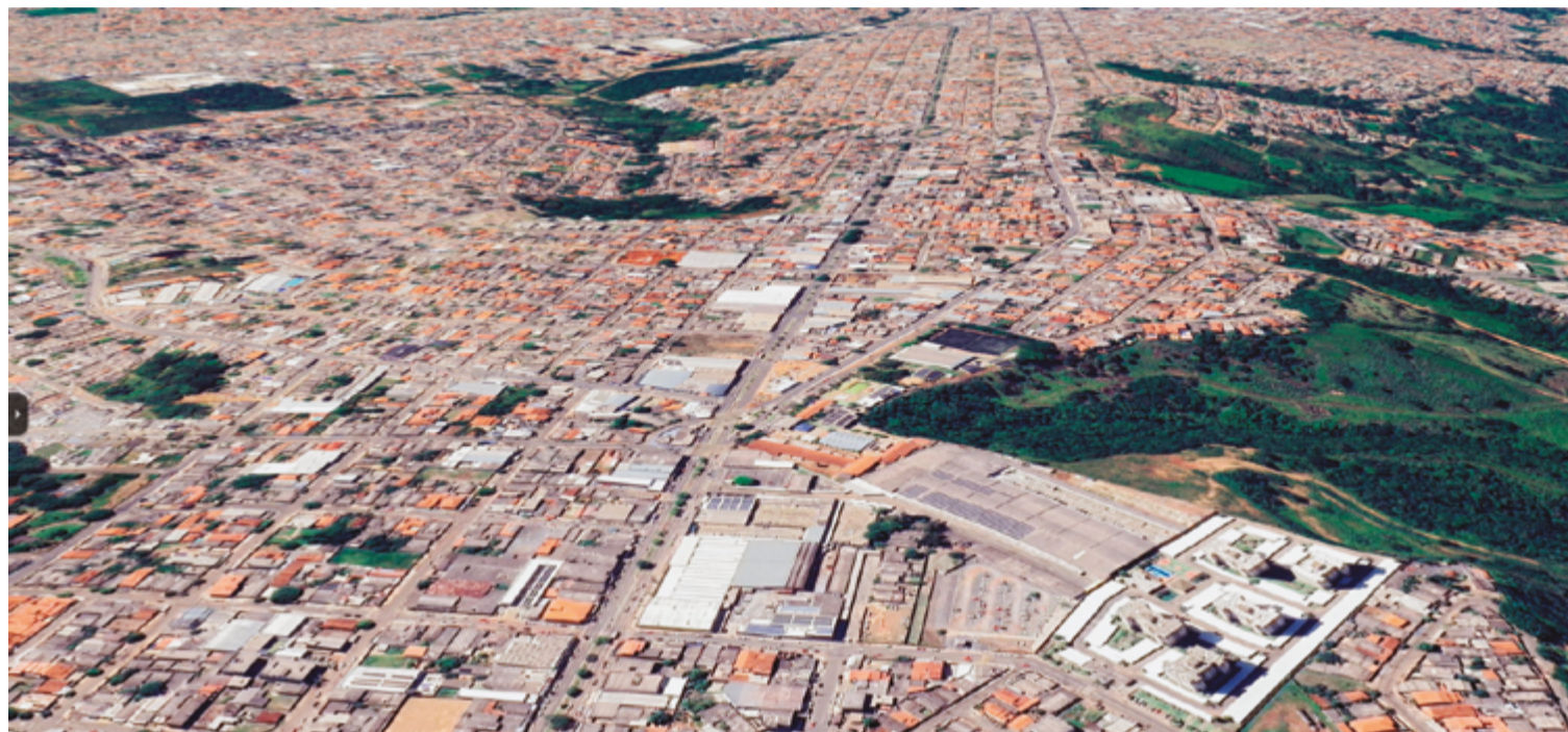
Anápolis já foi considerada a cidade mais feliz do Brasil pelo Instituto de Pesquisa Econômica Aplicada (IPEA): qualidade de vida e oportunidades

A cidade abriga o Distrito Agroindustrial de Anápolis (DAIA), que atualmente está passando por uma expansão com a previsão do DAIA 5.0,