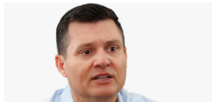
Flávio Pagotto: empresário e político