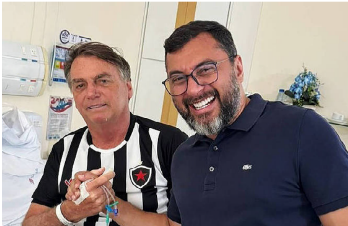
Wilson Lima e Jair Bolsonaro: eleições de 2026 distancia governador e ex-presidente

Já na corrida pela Prefeitura de Campo Grande, no Mato Grosso do Sul, com aval e participação direta do ex-presidente, o PL se aliou ao PSDB no estado e implodiu a aliança com o PP patrocinada pela senadora Tereza Cristina (PP-MS) na ca-